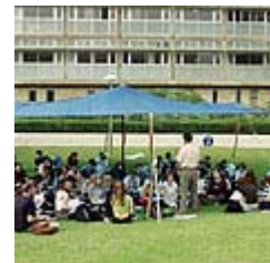
שביתה? אוניברסיטאות ת"א

מהטכניון נמסר: "ההסכם הארצי נחתם בראשי תיבות לפני מספר חודשים, בין האוניברסיטאות לבין ארגוני הסגל הזוטר. הטכניון וארגון הסגל הזוטר שלו לא חתמו על הסכם זה ולכן אינם צד בענין. אי לכך אי אפשר להאשים את הטכניון בטרפוד הסכם שאינו צד לו."