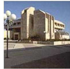
האוניברסיטה העברית. הנתונים - עד סוף החודש הבא