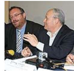
אורלב והרשקוביץ. "זה מנוגד להיגיון"

"הציפיות שלי הן שכל דרישות האוצר בחוק ההסדרים פשוט תמחקנה, זו פגיעה חמורה בהשכלה", אמר שר המדע דניאל הרשקוביץ לפני תחילת הדיון. "ההצעות מעידות על חוסר הבנה של המערכת. אני מתכוון להצביע נגד ויש הבנה של השרים שהדבר פשוט מנוגד להיגיון. זה מנטרל את ההתנהלות של האקדמיה. קיצוצים מעין אלו נוסו במקומות שונים בעולם ועד היום בוכים ומבכים עליהם".