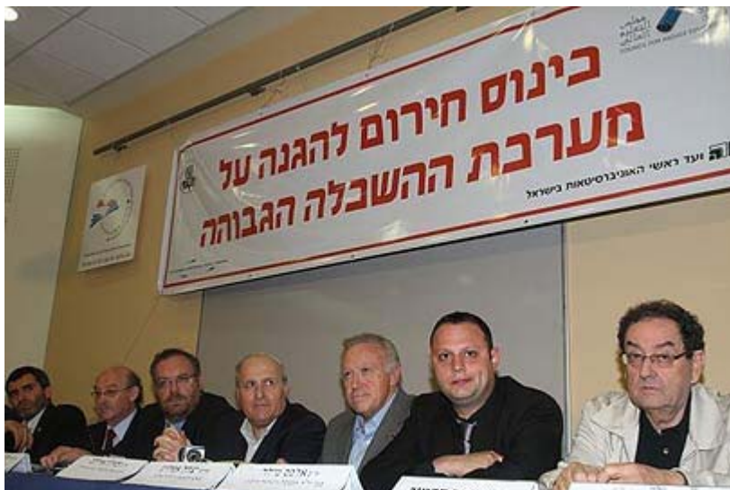
מודאגים מהקיצוץ. שולחן הבכירים בכינוס, הבוקר