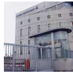
הקמפוס ברעננה. שביתה בעשרות מרכזים