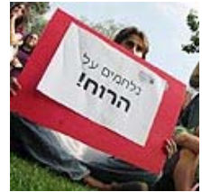
הפגנת סטודנטים למדעי הרוח.

ד"ר להיסטוריה ופילוסופיה של המדעים, מומחית למורשת אלברט אינשטיין