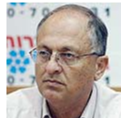
הכהן. "דברי הבלע"