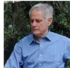
פרופ' צבי גליל