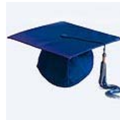
שבויים במודלים כלכליים