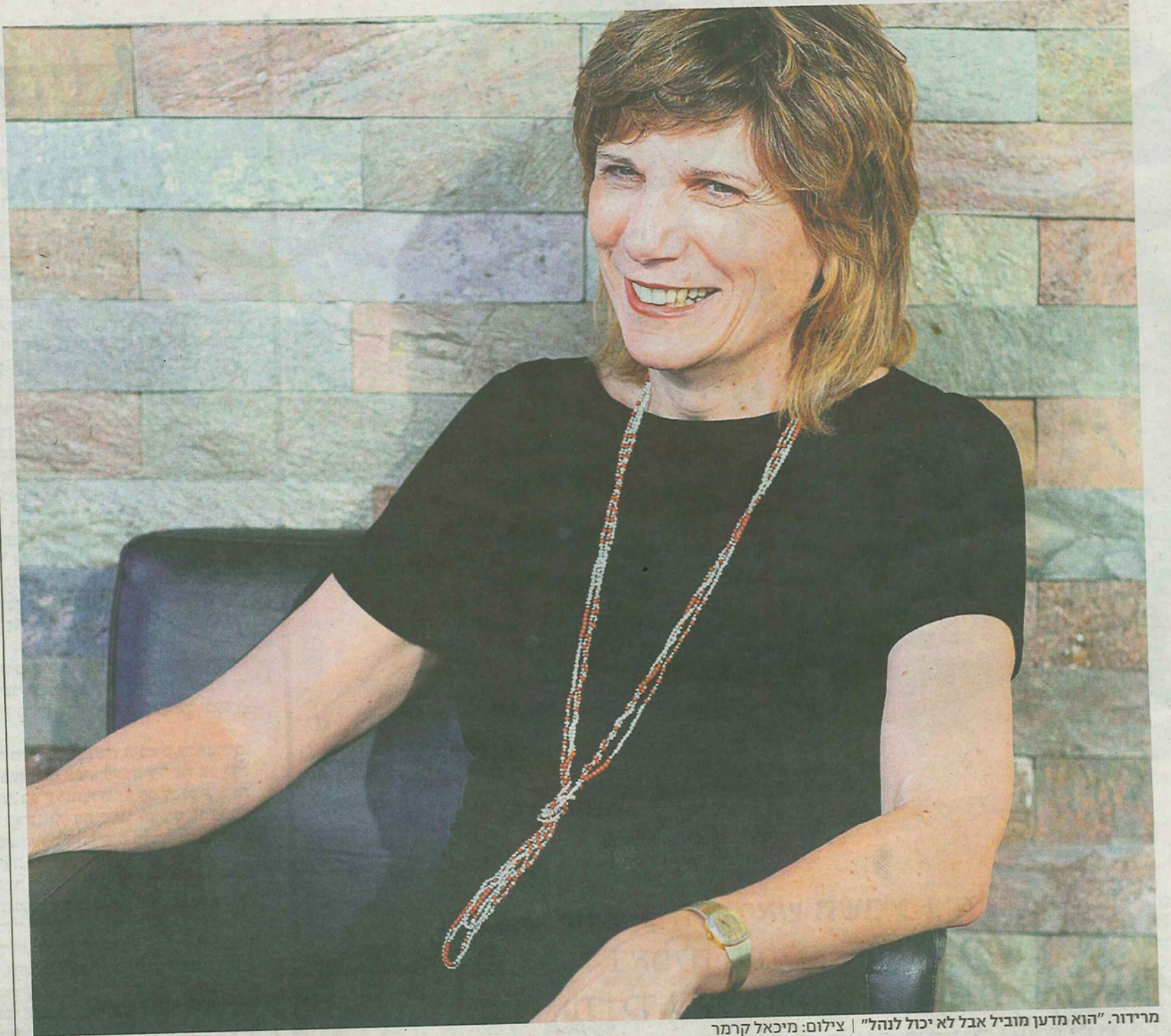
מרידור. "הוא מדען מוביל אבל לא יכול לנהל"

מרידור: "המטרה הייתה להגן על כבודו, לשמור על כבודה של האוניברסיטה. רציתי שיפרוש בהסכמה. הוא לא הבין על מה אני מדברת, חשב שהוא נשיא מצוין"