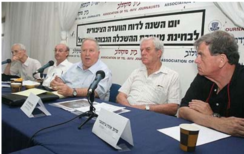
פרופ' צ'חנובר (מימין) במסיבת העיתונאים

שרת החינוך, פרופ' יולי תמיר, אמרה לאחר מסיבת העיתונאים: "שעון החול של מערכת ההשכלה הגבוהה נגמר. אני דורשת כי הצעת המחליטים שגיבשתי בתאום עם כלל הגורמים במערכת ההשכלה הגבוהה תעלה לדין ביום ראשון הקרוב בישיבת הממשלה, כפי שהובטח אצל שר האוצר. קבלת הודעה על הקצאת משאבים משמעותית למערכת ההשכלה הגבוהה והכרחית לה כאוויר לנשימה".