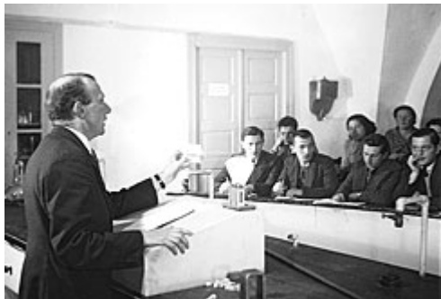
שיעור בפיסיקה באוניברסיטה העברית, 1935

במסגרת הרוחות הרעות הנושבות מעל עתידו של המחקר המדעי בכלל וההשכלה הגבוהה בפרט בישראל, עולה שאלת כדאיות ההשקעה. עד כמה כדאי להשקיע בתוצר השכלה שיש לו פחות ביקוש בשוק העבודה, או שכרגע אין לו בכלל ביקוש? במלים אחרות, האם יש טעם להשקיע משאבים במערכת השכלה שבסיומה לא יוצא סטודנט שיכול להרוויח הרבה כסף, או בתחום מדעי שאי אפשר למדוד אותו? ובמלים עוד יותר אחרות, מדוע לכלות כסף על תחומי ידע כמו אסטרופיסיקה, מתמטיקה תיאורטית, מדע המדינה, פילוסופיה, לימודי דרום-מזרח אסיה ומוסיקולוגיה?