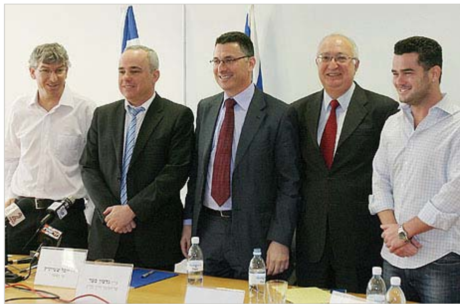
מימין טרכטנברג, גדעון סער, יובל שטייניץ ואודי ניסן בהכרזה על הרפורמה צילום: חיים צח

החזרת החוקרים אינה מיוחדת לישראל בימים אלה. "כולם בעולם היום מודאגים מאותם דברים. ישראל, וגם הודו וסין, מנסות להחזיר לארץ את המדענים שעזבו לארצות הברית, ובארצות הברית דואגים מכך שההודים והסינים והישראלים חוזרים הביתה. הכל סובב סביב ייצור, שימור, העברה ושימוש בידע", הוא אומר. בחודש מאי הוא השתתף כמרצה אורח בכנס בחסות ארגון ה-OECD שנערך בושינגטון, בנושא "נכסים אינטלקטואליים כמקור לגידול בתפוקה". לדבריו, "יש דאגה עמוקה שמא ארה"ב הולכת ומאבדת גובה, גם בחדשנות וגם במובילות הטכנולוגית שלה. אנחנו נמצאים במצב שהכלכלה העולמית מתנהלת היום, למעשה, ללא בעל בית".