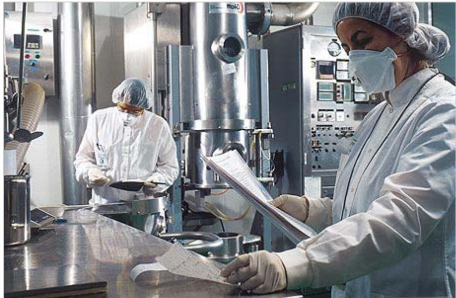
מעבדה של חברת טבע. לחברות בארץ קשה להתחרות עם התנאים שמוצעים למדענים בארה"ב

"שר האוצר יובל שטייניץ צריך להשקיע בתשתיות המחקר והפיתוח בישראל, כדי שהמדינה תוכל להמשיך לקלוט את ההון האנושי שהיא כבר השקיעה בו בעבר. את המדענים האלה אפשר וצריך לרתום למאמץ לשמירה על מעמדנו כמובילים בתחומי טכנולוגיה מגוונים: ביוטק, ננוטק, קלינטק, רפואה והיי טק. כדי להחזיר אקדמאים בכירים ולהפיק את המרב מניסיונם ומיכולתם, צריך ליצור מקומות עבודה שיציעו משרות ברמת מקצועיות גבוהה. אלו יכולים להיות מרכזי מו"פ של חברות בינלאומיות, מרכזי שיתוף פעולה בין האקדמיה והתעשייה ומשרות מחקר באוניברסיטה. נוסף על כך, המדינה צריכה לשמור על קשר שוטף עם ישראלים בכירים בחו"ל שרוצים לסייע לישראל ולהקים שם מרכז השמה קדמי, כדי להגדיל את פוטנציאל מציאת העבודה עבורם".