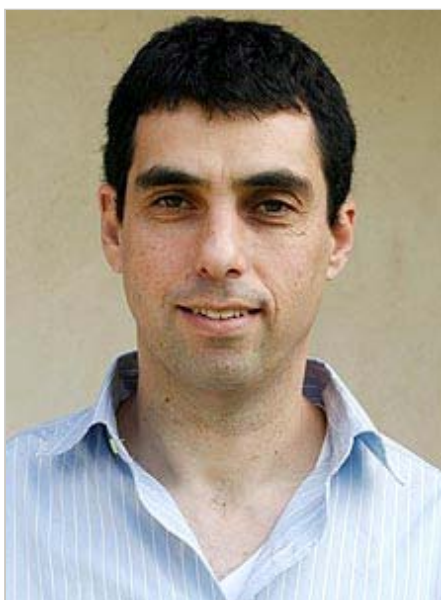
לוטם. "לרוב המדענים, המעבר לארה"ב הוא ברירת מחדל" מוטי מילרוד

לוטם מעריך כי כ-4,000 מהעוזבים באו מתעשיית מדעי החיים, מספר דומה של רופאים וכ-2,000 ממגוון רחב של תחומים, בעיקר מדעים מדויקים. רבים מהעוזבים יצאו לפוסט דוקטורט באחת האוניברסיטאות בחו"ל עם סיום לימודיהם, ונשארו שם בגלל הפיתוי המקצועי או הכספי.