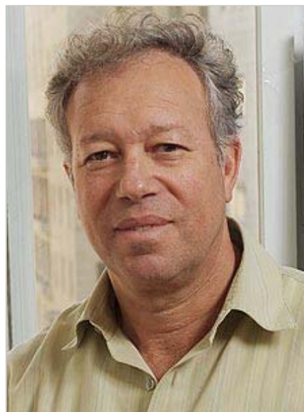
עמר' אינגבר, משרד הקליטה: צילום:

בעשור האחרון עזבו את ישראל כ-10,000 מדענים, שרובם ככולם כבר לא ימהרו לחזור. קצב בריחת המוחות נעצר מעט לאחרונה בגלל המשבר הכלכלי, אבל לא כדאי לפתור משבר אחד במשבר אחר. ברגע שארה"ב תתאושש, היא תזרים כספים בשפע למדענים והם לא יוכלו לסרב.