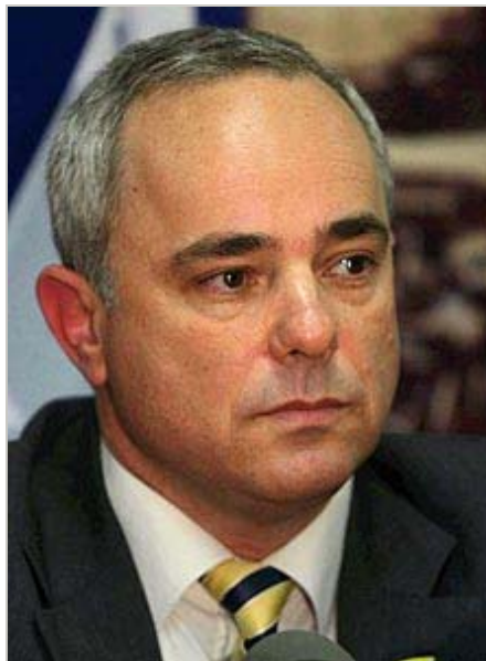
שטייניץ