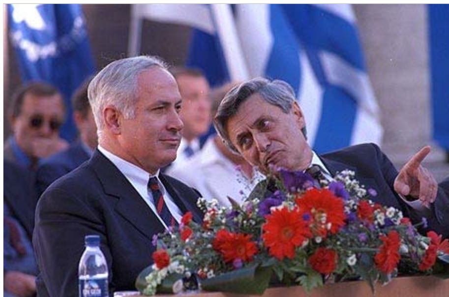
בנימין נתניהו בנאום נגד האוניברסיטאות, 1997 (עם רקטור האוניברסיטה צילום: עמוס בן העברית אז, פרופ' חנוך גוטפרוינד) גרשום, לע"מ

הרשות הזאת, לפי ליבוביץ, תכלול את העיתונות החופשית ובעיקר את אוניברסיטאות המחקר; לא גופי מחקר אחרים או מוסדות השכלה גבוהים שמחפשים ידע פרקטי, מכוון צרכים ואינטרסים, אלא אוניברסיטאות שמחפשות ידע לשם הידע. ובחזון של ליבוביץ, כפי שהעולם דבק כיום בעקרון הפרדת הרשויות, ששומר על שלוש הרשויות הקיימות מפני התערבות חיצונית, גם הרשות היודעת צריכה להיות עטופה בעצמאות כזאת, חד-משמעית ובטוחה.