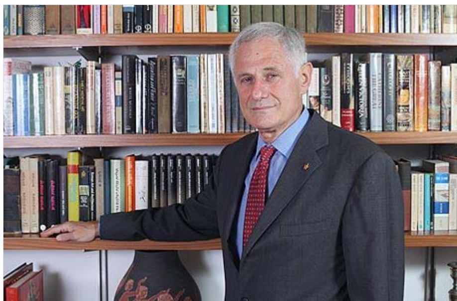
פרופ' צבי גליל, הנשיא המודח של אוניברסיטת ת"א. "הוכחה לכך שהכוח כבר לא בידי הפרופסורים"

"אמנם תמיד היתה תעמולה, אבל לא באופן הכולל והמוחלט שבו אפשר לעשות זאת היום, בכלים הטכנולוגיים העכשוויים. הטכנולוגיה יצרה שינוי כמותי, אבל זהו גם שינוי איכותי שישפיע על האבולוציה שלנו. ראינו את זה בגרמניה, כשקבוצה קטנה של אנשים שנבחרו באופן דמוקרטי הפכה 60 מיליון גרמנים לרוצחים בפועל או בפוטנציה; ראינו את זה במשטרים מאחורי מסך הברזל; תעמולת הצריכה האמריקאית היא אותו דבר, ובעצם כל תעמולה מסחרית מוכיחה את זה. וככל שאמצעי התקשורת משתכללים, כך זה גדל והולך. האדם במאה ה-21 שטוף, 24 שעות ביממה, בחדירה למוח שלו, חדירה שבמידה רבה מאוד מעצבת את רצונו ואת מחשבתו. אין אדם שלא מרגיש את זה".