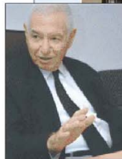
מבקר המדינה, מיכה לידנשטראוס

ותקצוב, למצוא את הפתרון. מה שכן אנו יכולים לומר, זה שמעכשיו אף אחד לא יוכל להגיד 'לא ידענו'.